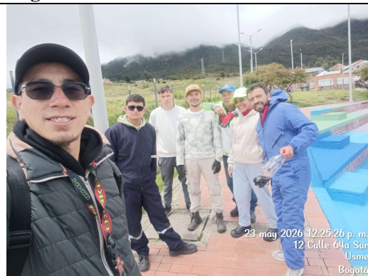
Fotografía 6. Finalización