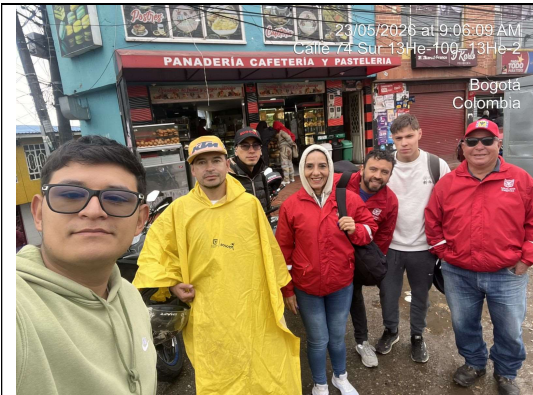
Fotografía 1. Foto de inicio de actividades